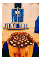
Minnesamling Allehelgen -24

Sorgarbeid er som alltid en viktig oppgave. Vi har mange individuelle samtaler som handler om sorg og inntrykket er at det stadig er et økende behov. Vi har også hatt tilbud om sorggruppe både våren og høsten 2024. Etterspørselen på å delta ser vi varierer en del, men vi prøver å tilpasse oss best mulig. Det var kun gruppen på høsten som ble fulltegnet, de som meldte interesse på våren ble fulgt opp på andre måter.